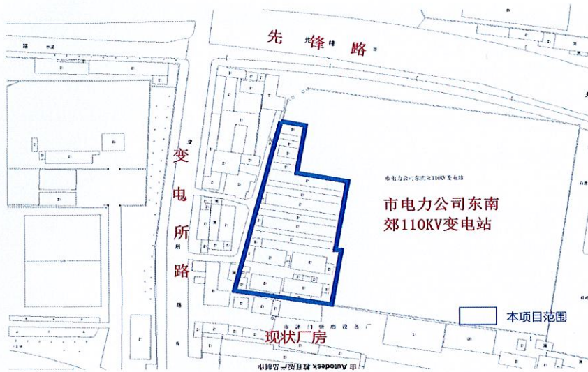
变电所路平房征收范围示意图