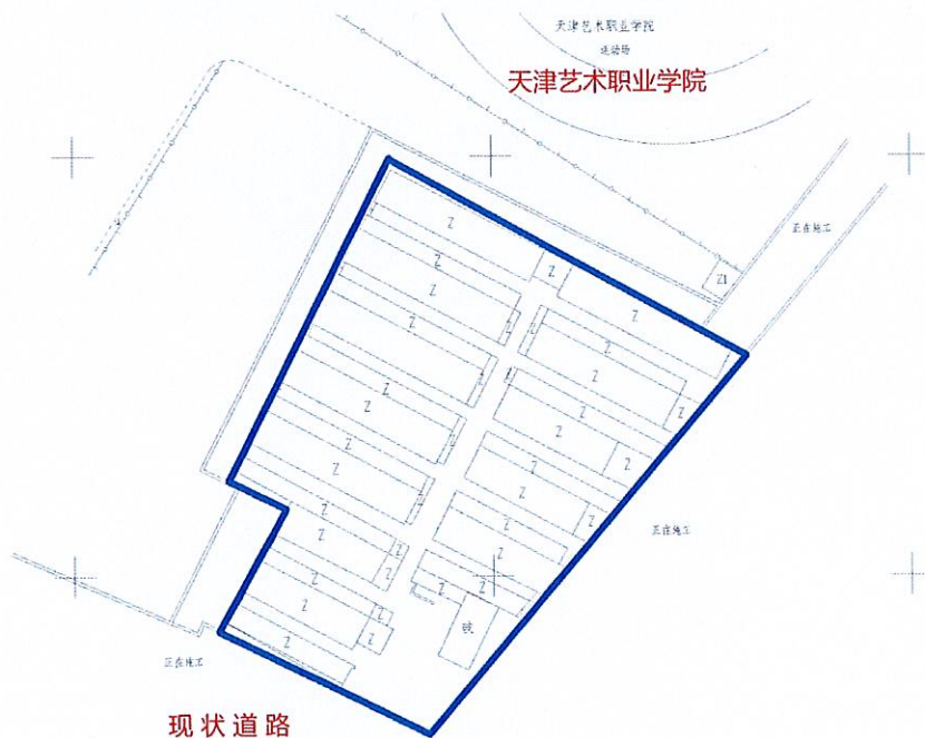
月牙河南路平房片区征收范围示意图